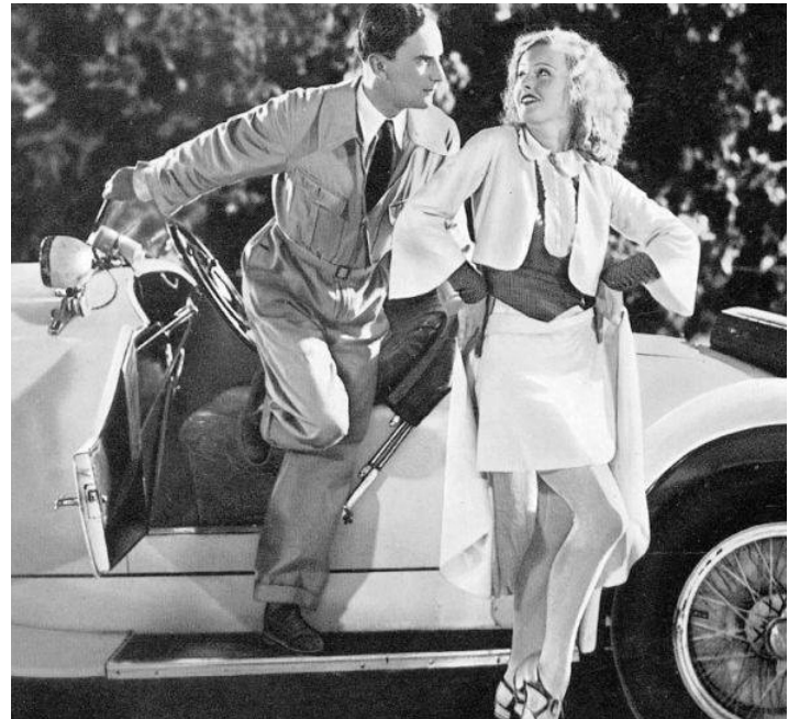
1930 LE CHEMIN DU PARADIS (Die drei von der Tansstelle) de Wilhelm Thiele avec Oskar Karlweis