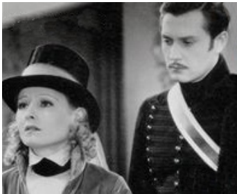
1935 INVITATION À LA VALSE (Invitation to the Waltz) de Paul Merzbach avec Carl Esmond