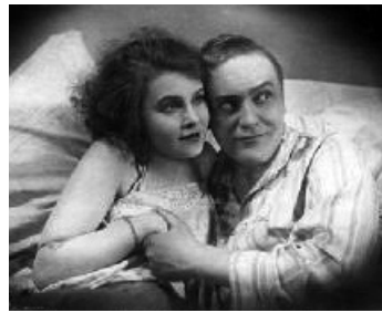
1925 AMOUR ET UNIFORMES (Liebe und Trompetenblasen) de R. Eichberg avec Harry Liedtke