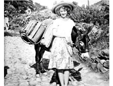
1929 QUAND TU VOUDRAS DONNER TON CŒUR (Wenn der einmal dein Herz...) de Johannes Güter