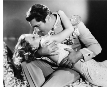
1933 LES QUARANTE CHEVAUX DU ROI (My Lips Betray) de John G. Blystone avec John Boles