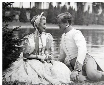
1937 FANNY ELSSLER (Fanny Elßler) de Paul Martin avec Rolf Möbius