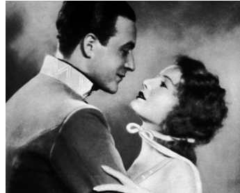
1929 VALSE D'AMOUR (Liebeswalzer) de Wilhelm Thiele avec Willy Fritsch