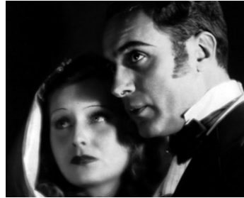
1933 LE CHANT DU CŒUR (The Only Girl) de Frederick Hollander avec Charles Boyer