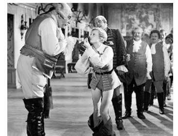
1938 CAPRICCIO (Capriccio) de Karl Ritter avec Paul Kemp