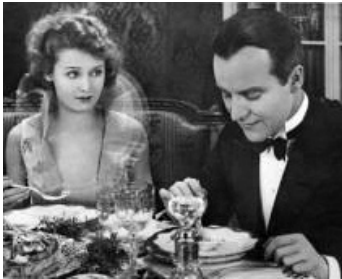
1929 ADIEU MASCOTTE (Das Modell vom Montparnasse) de Wilhelm Thiele avec Igo Sym