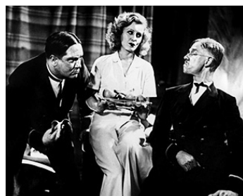
1931 CALAIS-DOUVRES de Jean Boyer et Anatole Litvak avec Gabriello, Armand Bernard