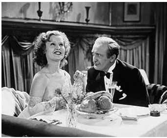
1932 QUICK (Quick) de Robert Siodmak avec Hans Albers