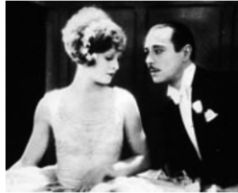
1927 ÈVE EN PYJAMA (Ein Nacht in London) de Lupu-Pick avec Bernard Nedell