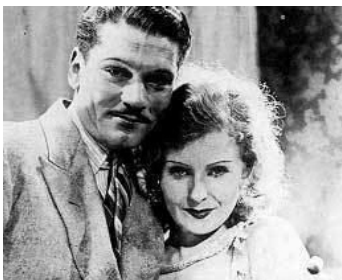
1930 LA VEUVE TEMPORAIRE (The Temporary Widow) de G. Ucicky avec Laurence Olivier