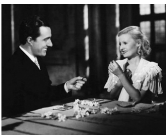
1938 DANS LA VIE BLEUE (Castelli in Aria) d'Augusto Genina avec Vittorio De Sica