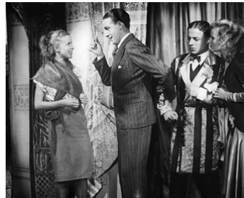
1930 FLAGRANT DÉLIT (Einbrecher) de Hanns Schwarz avec Heinz Rühmann, Willy Fritsch