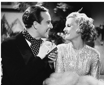
1936 LES GAIS LURONS (Glückskinder) de Paul Martin avec Willy Fritsch