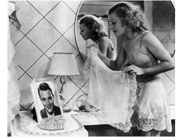
1933 FLIRTEUSE (My Weakness) de David Butler avec Lew Ayres