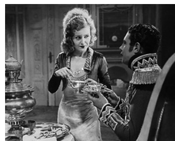
1931 LE CONGRÈS S'AMUSE (Der Kongreß tanzt) d'Erik Charell avec Willy Fritsch