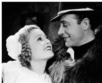
1937 LES SEPT GIFLES (Sieben Ohrfeigen) de Paul Martin avec Willy Fritsch