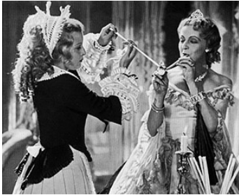
1933 MOI ET L'IMPÉRATRICE (Ich eine die Kaiserin) de Friedrich Hollander avec Mady Christians