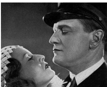
1931 PLUS JAMAIS D'AMOUR (Nie wieder Liebe) d'Anatole Litvak avec Harry Liedtke