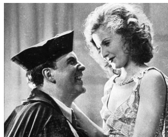
1930 HOKUS POKUS de Gustav Ucicky avec Willy Fritsch