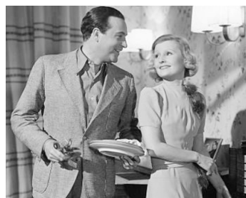
1939 MÉNAGE MODERNE (Frau am steuer) de Paul Martin avec Willy Fritsch