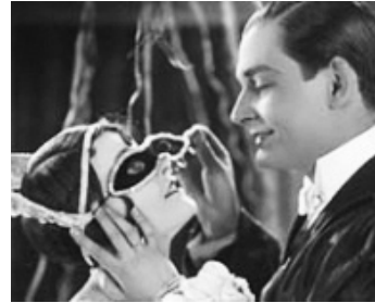
1927 LOLA N'EST PAS FOLLE (Die tolle Lola) de Richard Eichberg avec Harry Halm