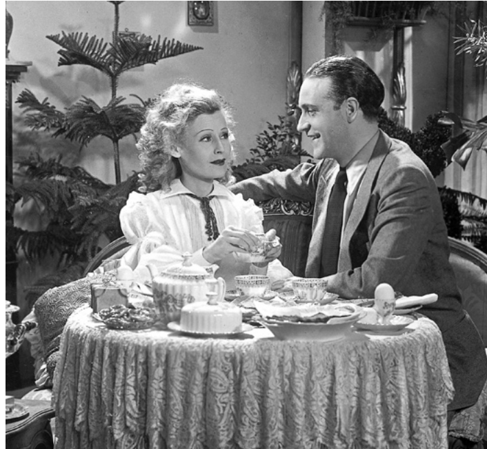
1935 ROSES NOIRES (Schwarze Rosen) de Paul Martin avec Willy Fritsch