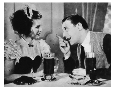
1931 PRINCESSE, À VOS ORDRES ! de Hans Schwarz & M. de Vaucorbeil avec Henri Garat