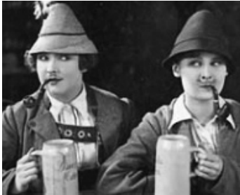
1928 LA PETITE VOLEUSE (Du sollst nicht stehlen) de Victor Janson avec Dina Gralla