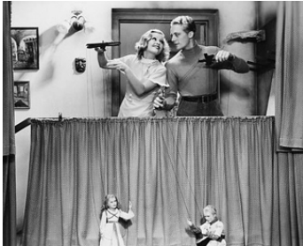
1934 SUZANNE, C'EST MOI (I am Susan) de Rowland V. Lee avec Gene Raymond