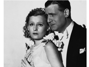
1934 RÊVE À MONTE-CARLO (Let's live tonight) de Victor Schertzinger avec Tullio Carminatti