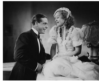
1932 ZWEI HERZEN UND EIN SCHLAG de Wilhelm Thiele avec Wolf Albach-Retty