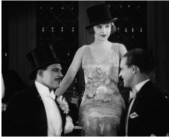
1927 LA CHASTE SUZANNE (Die keusche Susanne) de R. Eichberg avec Albert Paulig, Willy Fritsch